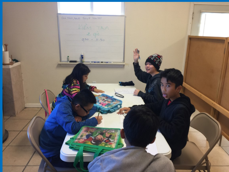
Giờ kiểm tra giữa khóa