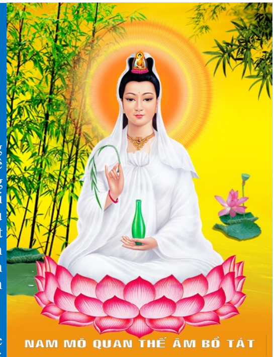
NAM MÔ QUAN THẾ ÂM BỒ TÁT

Nam Mô Cao Đài Tiên Ông Đại Bồ Tát Ma Ha Tát.