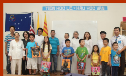
25-5-2014 - Lễ Bế Giảng Khóa #2 Trung Tâm Việt Ngữ Minh Đức